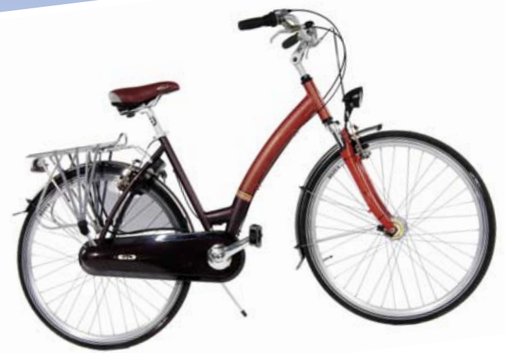
Premier lot Vélo Montégo Avantgard 7 d'une valeur prix public de 429 € offert par Cyclable.

Jeu concours organisé par la FUBicy, Fédération française des Usagers de la Bicyclette Plus 250 lots d'une valeur totale de plus de 11 000 €